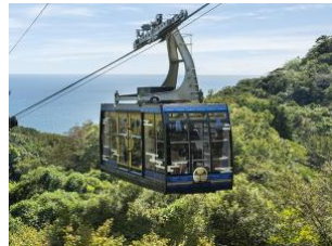
日本平ロープウェイ