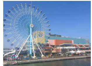
エスパルスドリームプラザ